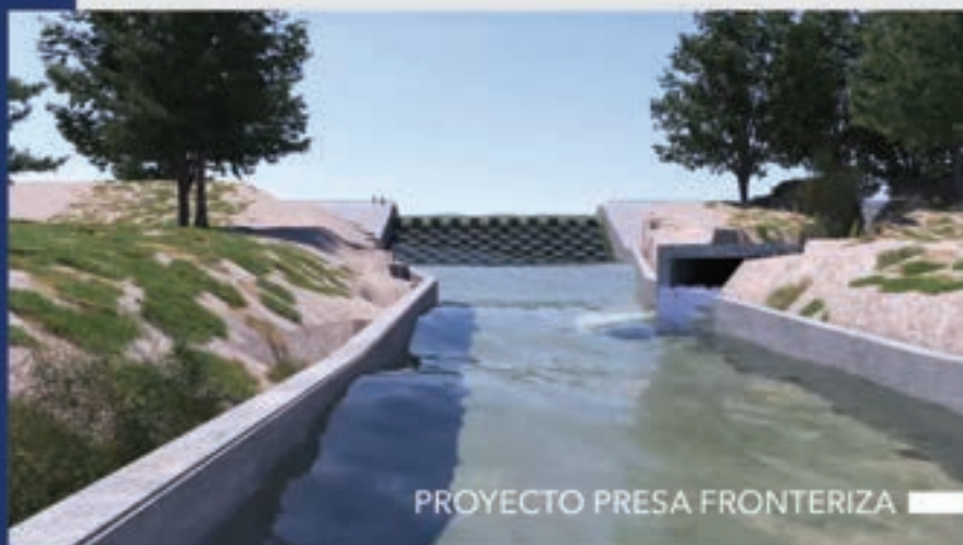
PROYECTO PRESA FRONTERIZA

Como obra contemplada al cierre del 2022 y al inicio del 2023, se encuentra la construcción de la presa Filtro II, con una inversión de 70 millones de pesos, se inició en agosto de 2022 y se terminará en agosto de este 2023.