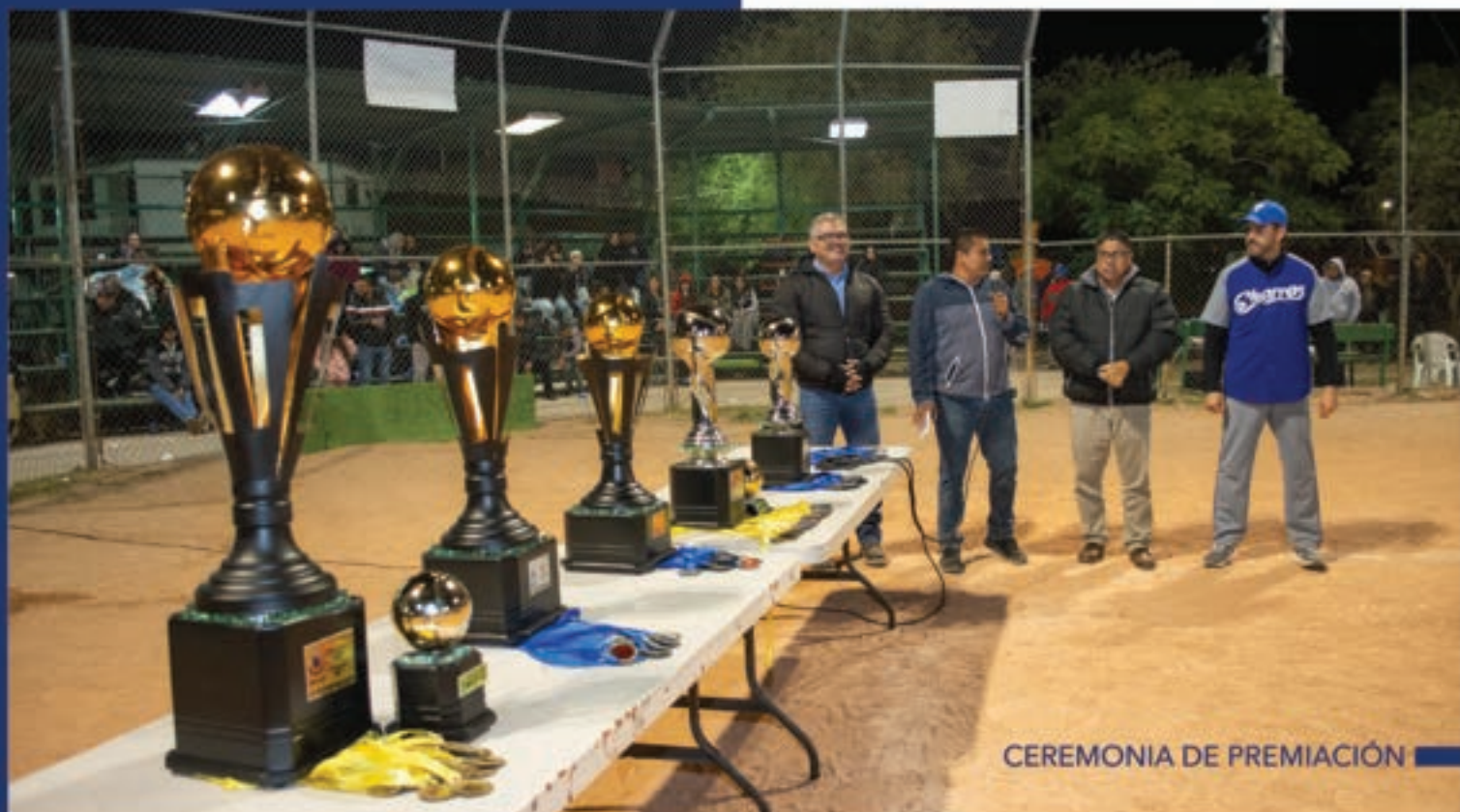
CEREMONIA DE PREMIACIÓN