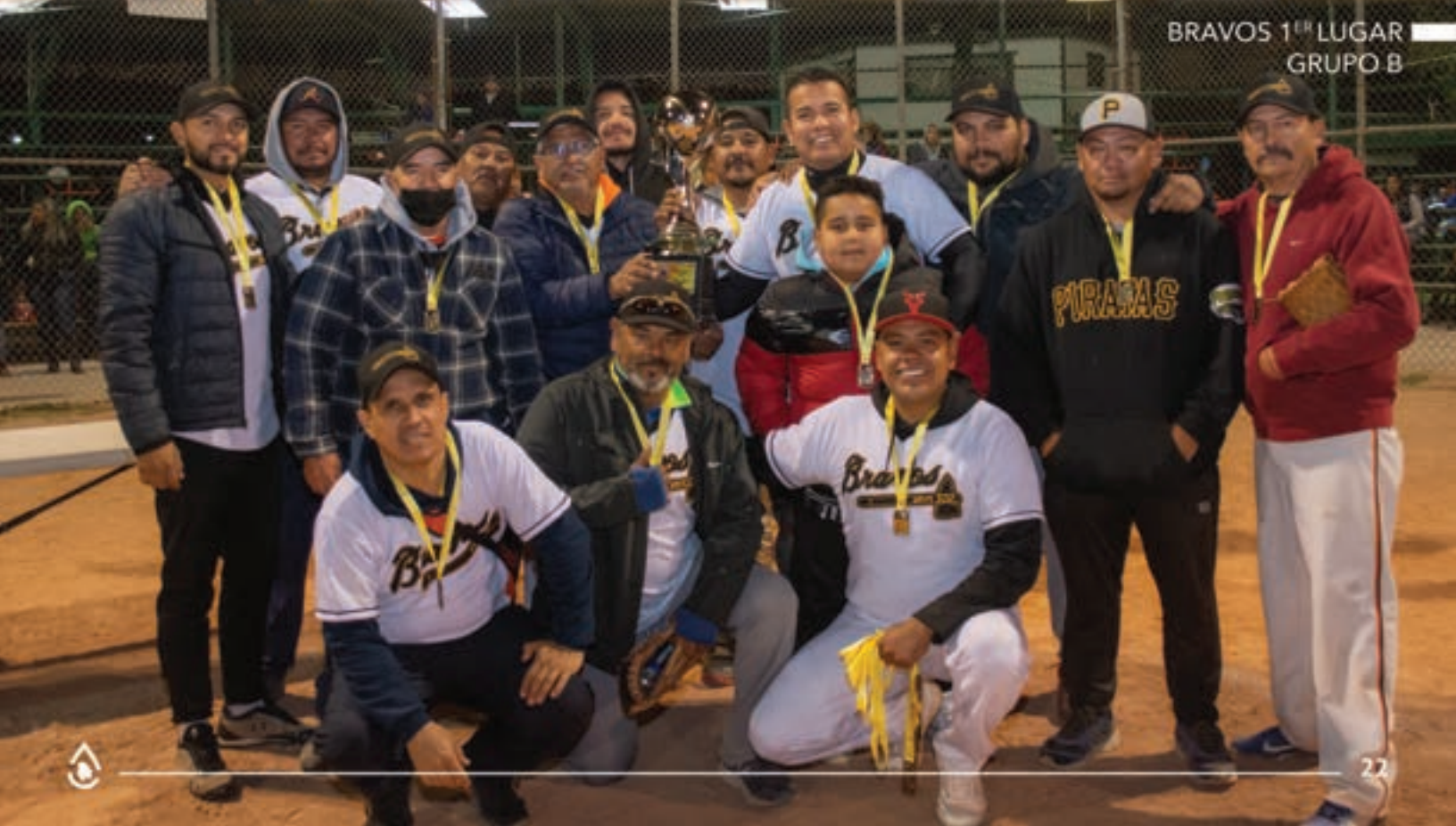
BRAVOS 1 ER LUGAR GRUPO B