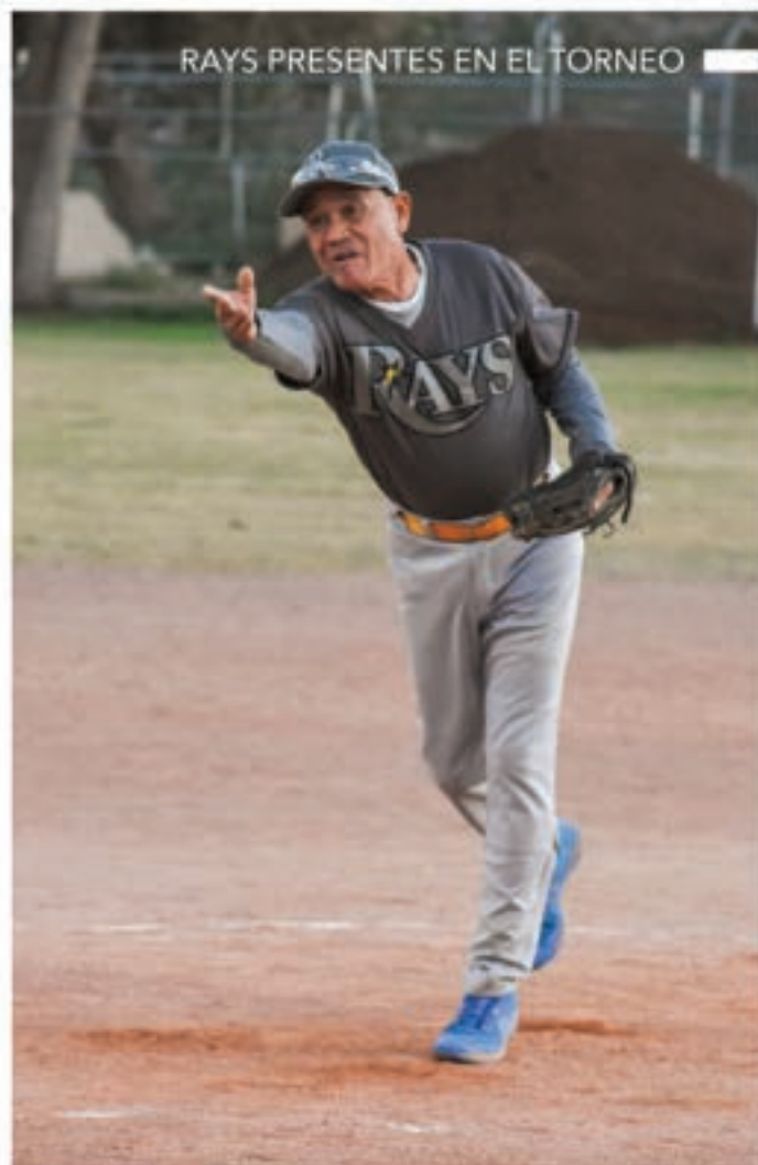
RAYS PRESENTES EN EL TORNEO

FOMENTAMOS EL DEPORTE ENTRE PERSONAL Y FAMILIAS DE LA J+